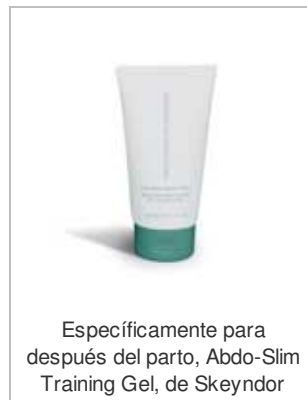
Específicamente para después del parto, Abdo-Slim Training Gel, de Skeyndor

Exceso de piel, flacidez y acumulación de grasa no deseada en el abdomen. ¿Sientes que tu cuerpo está sufriendo todos estos cambios? Tranquila, no te desespere porque te traemos la solución.